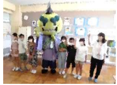
3・4年生の「ぶしゅかん」学習のスター トに市役所の職員さんだけでなく、ぶ しゅ庵クンも応援に来てくれました!!