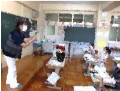
西川 ■■■さんによる1・2年生の 絵手紙教室。熱いご指導に子どもた ちのやる気もドンドン上昇中！

TVニュース等で報道されているように、全国の観光地等のこの3連休の人出を見ると、当面はこの状態が続きそうです。夏休みの間、利岡っ子とご家族皆さんが健康かつ安全安心に過ごしてくれることを願ってやみません。9月1日に真っ黒に日焼けした子どもたちに会えることを楽しみに待っています。