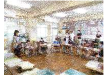
中学年同様、パソコン(ネット)に関する親との約束事と誘惑の狭間での葛藤という今日的な題材で学習する5・6年生！

また、先日の「道徳教育参観日」には真夏日の蒸し暑い日にも関わらず、ほぼ全てのご家庭にご来校いただきました。子どもたちも「緊張した!?!」と言いながらも、やっぱり嬉しかったようです。改めて御礼申し上げます。