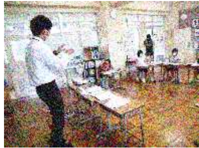
ネットへの誘惑と母親との約束事に揺れる登場人物に自身を重ねている3・4年生でした。