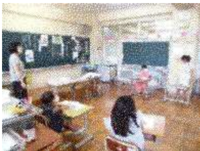
「自分が嫌なことは人にもしない」と本時のまとめを述べた ■■■ さん。真剣に悩み、葛藤する1・2年生です。

1学期も来週の2日を残すのみとなりました。新型コロナウイルス感染拡大＝第7波が全国を席卷していますが、利岡っ子は元気です。6月に早くも都市部で(インフルによる)学級閉鎖が出る等、インフルエンザとコロナのダブル流行も危惧されている昨今、元気に楽しく学校生活を送ってくれていることが何よりです。