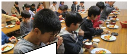
広島の前住生での昼食 同じ方向を向いて、コロナ対策もバッチリ！