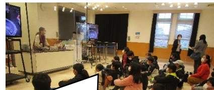
江波山気象館でのサイエンスショー 驚きがたくさん！