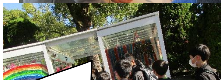
全校のみんなで思いを込めて作った千羽鶴を代表 して持って行きました。