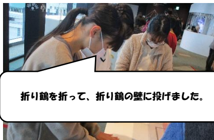
折り鶴を折って、折り鶴の壁に投げました。