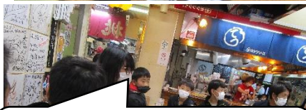
「今まで食べたお好み焼きの中で一番おいしい！」と大絶賛。