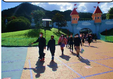
1番楽しみにしていたレオマワールド 他の学校の友達ともたくさん遊んでいい思い出ができました。