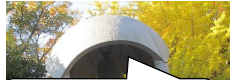
世界中の平和を願って、平和の鐘を鳴ら しました。