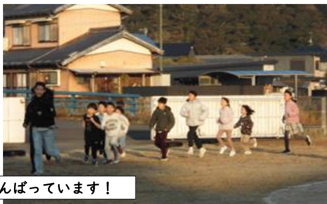
朝と夕方、陸上練習がんばっています！