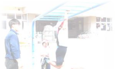
1. 2年生 体育 雲梯