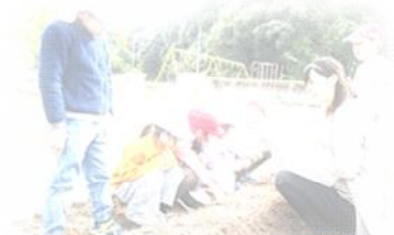
2年生 生活科 畑づくり