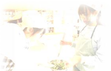
6年生 家庭科 調理実習