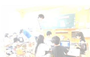
3. 4年生 社会 DX