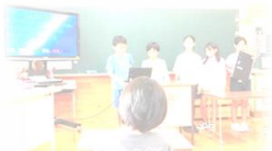
5年生 1年生への読み聞かせ