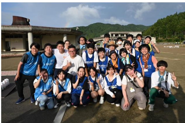
おかえりプロジェクト スタッフ