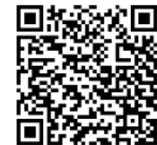
授業評価アンケート