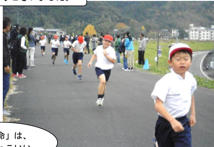
「一生懸命」は、とてもカッコいい。