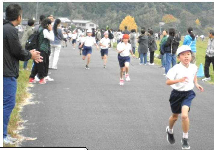
たくさんの応援ありがとうございました。