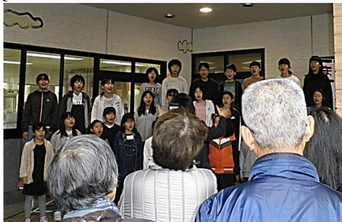
合唱部 地域貢献で歌声披露！

物産館「サンリバー四万十」さんが、一条大祭の関連イベントを開催しました。昨年度に引き続き本校合唱部が地域貢献のために参加させていただきました。大勢の人の前でも堂々と美しい歌声を響かせていました。聴いていた方々もその歌声に聴き惚れていた様子でした。とても立派でした。