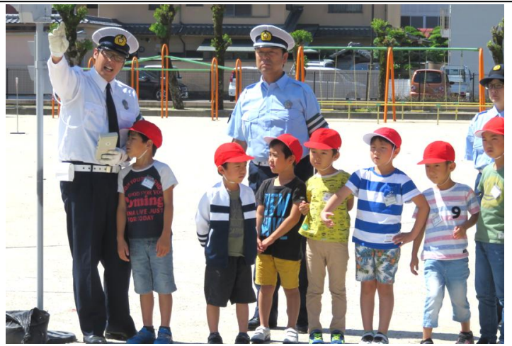
四万十市生活環境課、中村警察署、四万十市交通安全指導員の皆さん、暑い中ありがとうございました。