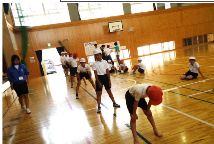
反復横跳び、俊敏な動き！時間いっぱいガンバレ！