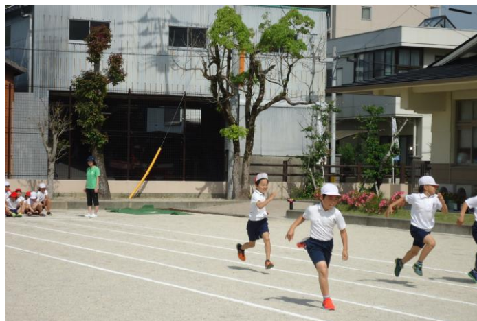
50m走。前を向いて、腕をふって、足を上げて。