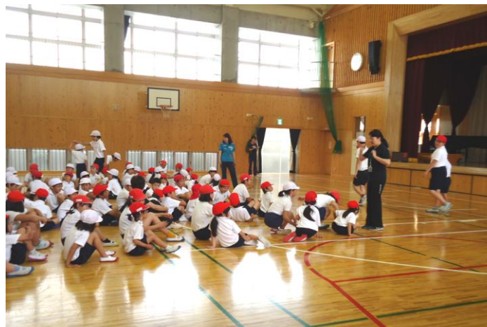
体育館で上体起こしと反復横飛びの説明。

職場体験に来てくれていた、中学生4人も、ミニ先生になってサポートしてくれました。