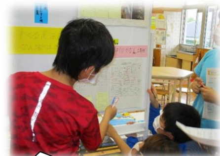
伝えたいことに合った資料と文章になっているかな