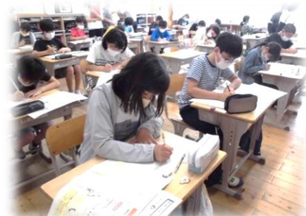
アドバイスを生かして文章を書いています

授業者のリフレクションシートより 目標 推敲チェックリストを活用すると、何ができて何が足りないのかより明確にできた。また、子どもが見つけた資料と文章のつながりなどを子どもの言葉で説明させるべきだった。今後、子ども自身に説明させていきたい。 課題 特活と関連させ、単元に入る前に南海大地震についての情報を得て身近に感じさせることができ、常に前向きに取り組めたことがよかった。また、「なぜ推敲するのか。」問うことで、必要感をもたせることができた。 見・考 言葉の掲示や宝箱を活用して照らし合わせながら推敲することができた。言葉の意味や漢字の表記など、もっとこだわらせることで、伝えたいことをはっきりさせ、正しい表現の仕方を理解できるようにしていきたい。