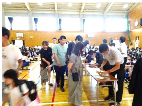
引き渡しカードで名前の確認 →