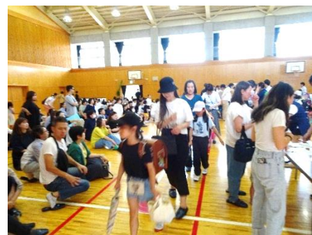
親子で一緒に・・・