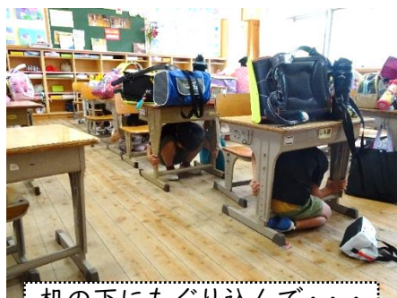
机の下にもぐり込んで・・・揺れが治まるのを待ちます