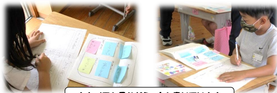
たねメモを見ながら、文を書いています